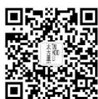
微信服务号 @三里屯太古里服务号: BJTaikooliSanlitun